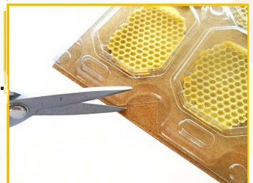
Установите рамку на кроющую диафрагму. Отрежьте ножницами клипсы, упирающиеся в диафрагму.