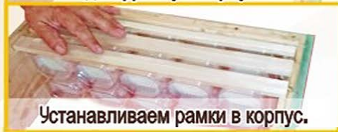
Устанавливаем рамки в корпус.