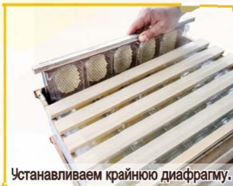
Устанавливаем крайнюю диафрагму.