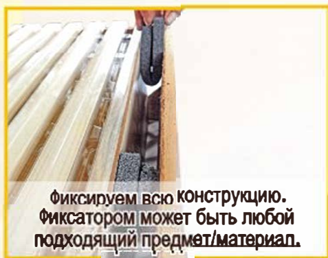
Фиксируем всю конструкцию. Фиксатором может быть любой подходящий предмет/материал.