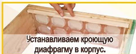
Устанавливаем кроющую диафрагму в корпус.