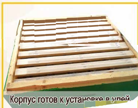
Корпус готов к установке в улей.

Рекомендуется отделить медовые корпуса от расплодной части улья ганемановской решёткой во избежании появления в рамках для сотового меда трутневого расплода.