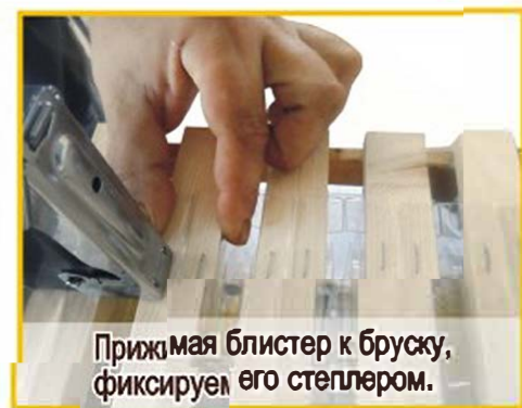
Прижимаем блистер к брусу, фиксируем его степлером.