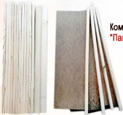
Комплект крепежа для коробки "Панский сот 145 мм"