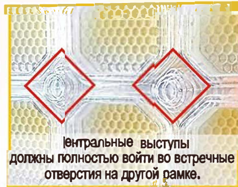
Центральные выступы должны полностью войти во встречные отверстия на другой рамке.