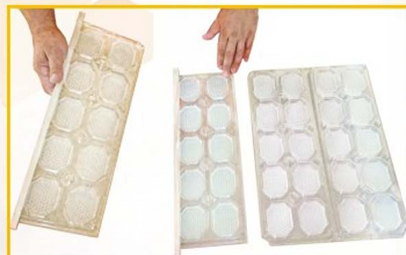
Разъедините одну пару рамок и одну рамку установите на диафрагму.