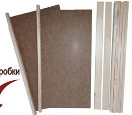
Комплект крепежа для коробки "Панский сот 230 мм"